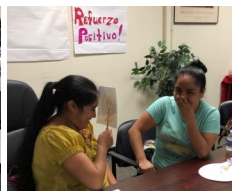
Las familias de Cool Spring participan en el aprendizaje con sus hijos en la Fiesta de Aprendizaje Socio-emocional que se lleva a cabo en noviembre.