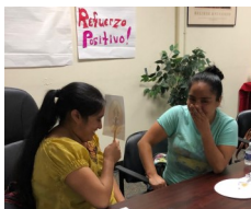
Cool Spring families are engaged in learning with their children at the Social-Emotional Learning Party held in November.