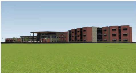
MAIN ENTRY / CLASSROOM WING - VIEW FROM SOUTHEAST