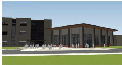
REAR ENTRY / CAFETERIA - VIEW FROM NORTH