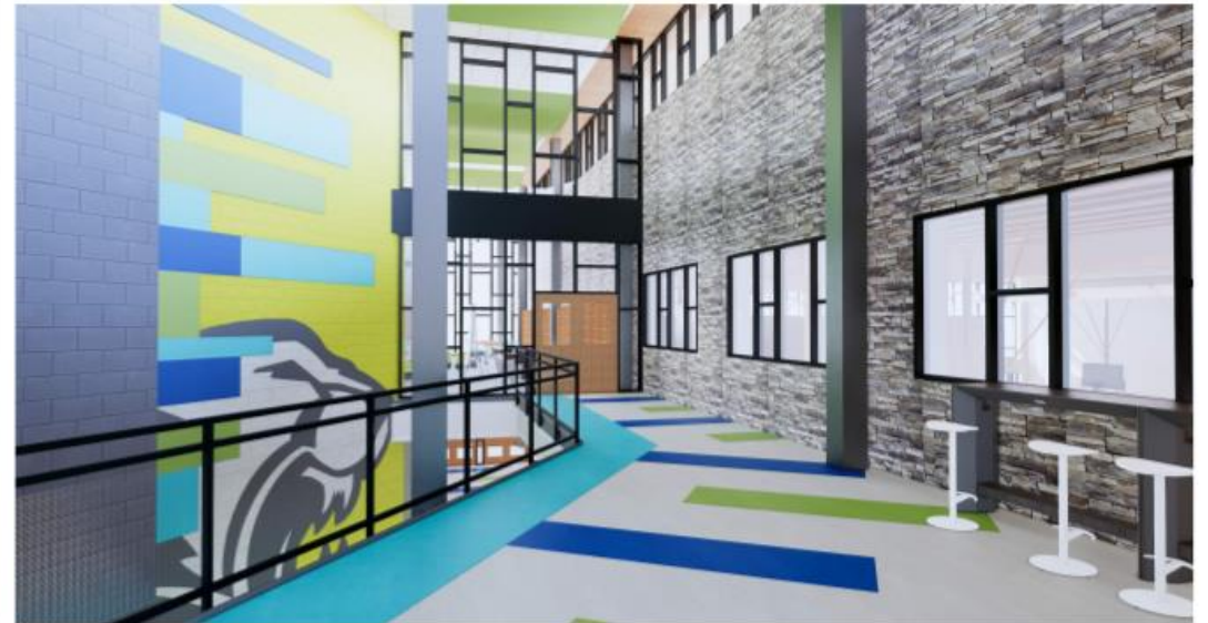
LOBBY - 2ND FLOOR