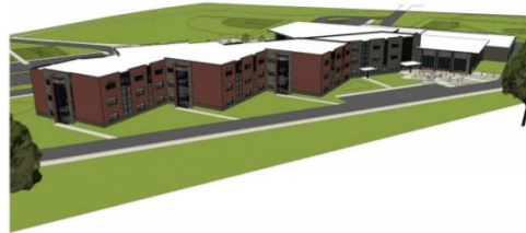
CLASSROOM WING - VIEW FROM NORTHEAST REAR