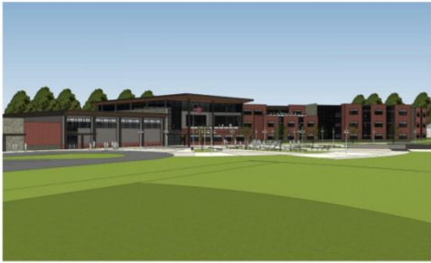
MAIN ENTRY / GYMNASIUM - VIEW FROM SOUTHWEST

La fase 4 incluye la finalización de todo el trabajo del sitio, incluida la finalización de la instalación del sistema de aguas pluviales, estructuras de biorretención, un nuevo campo de béisbol, asientos de anfiteatro, nuevo circuito de autobuses, canchas de juego de superficie recién pavimentadas, cercas y un nuevo lote de estacionamiento con acceso a la calle Tuckerman.