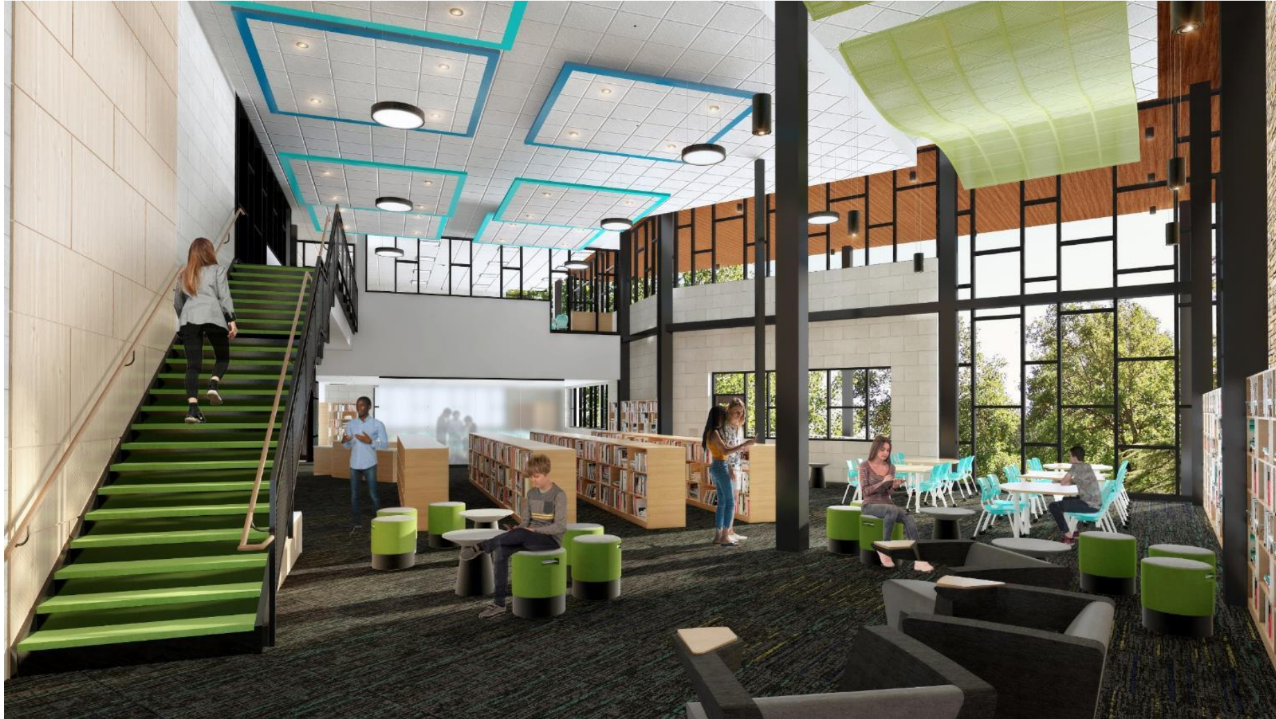
المكتبة/ غرفة الوسائط المتعددة