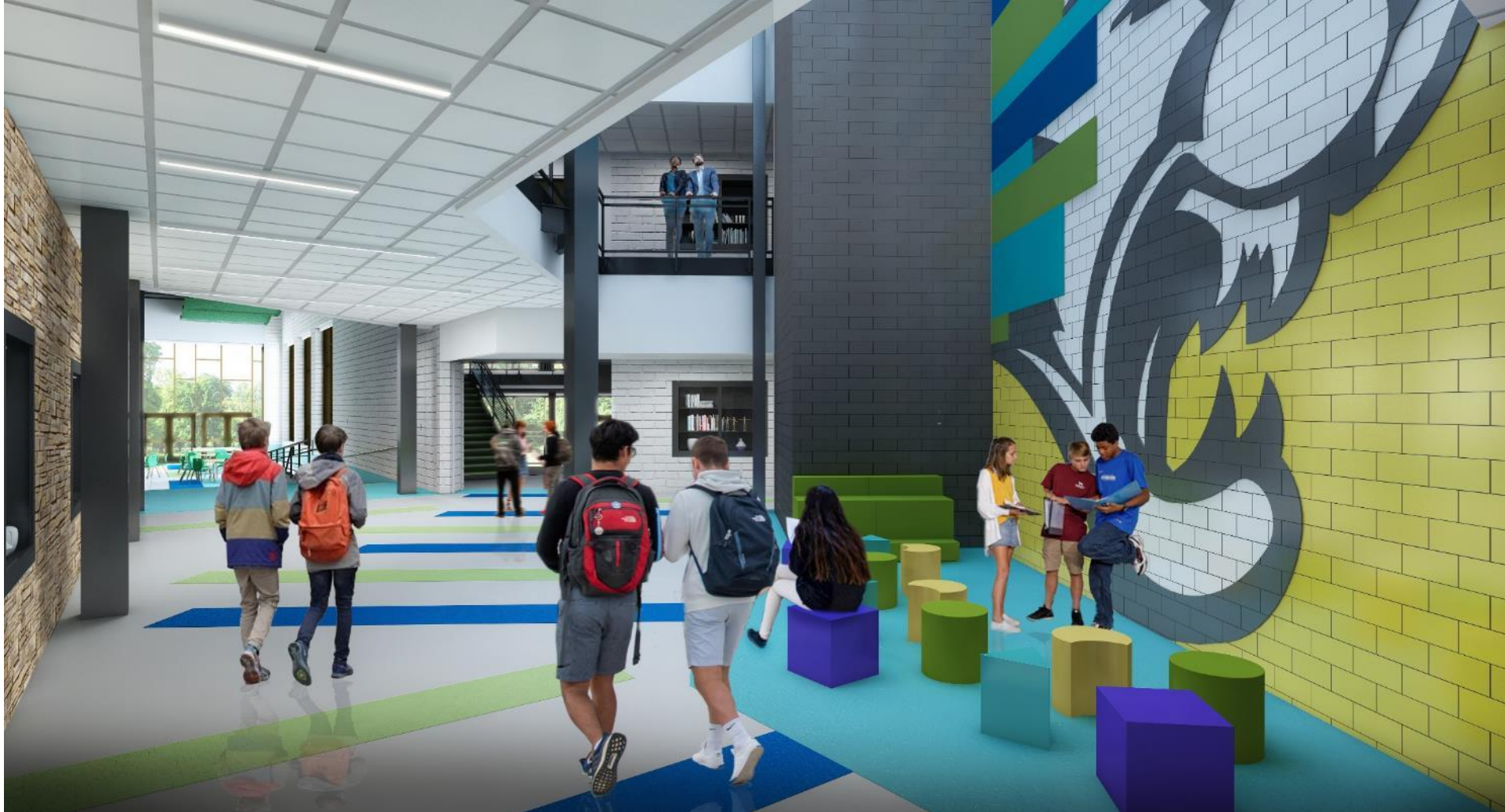
المنطقة المشتركة ط1