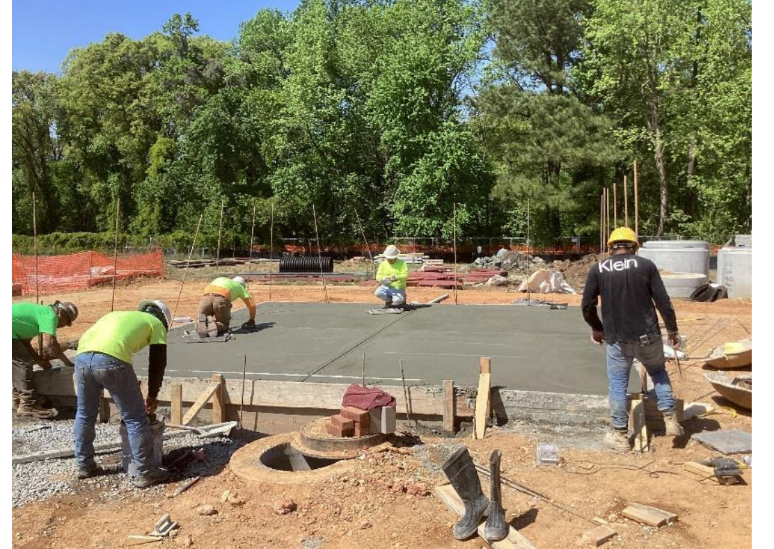
لمواد البناء SOG