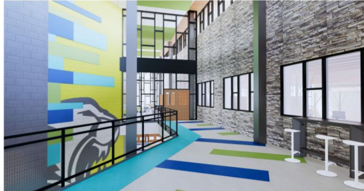
ممر ط 2