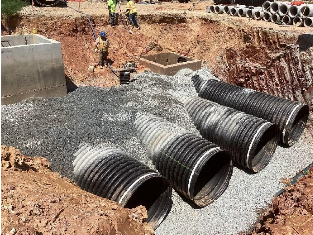
الأعمال الأرضية لمواد البناء