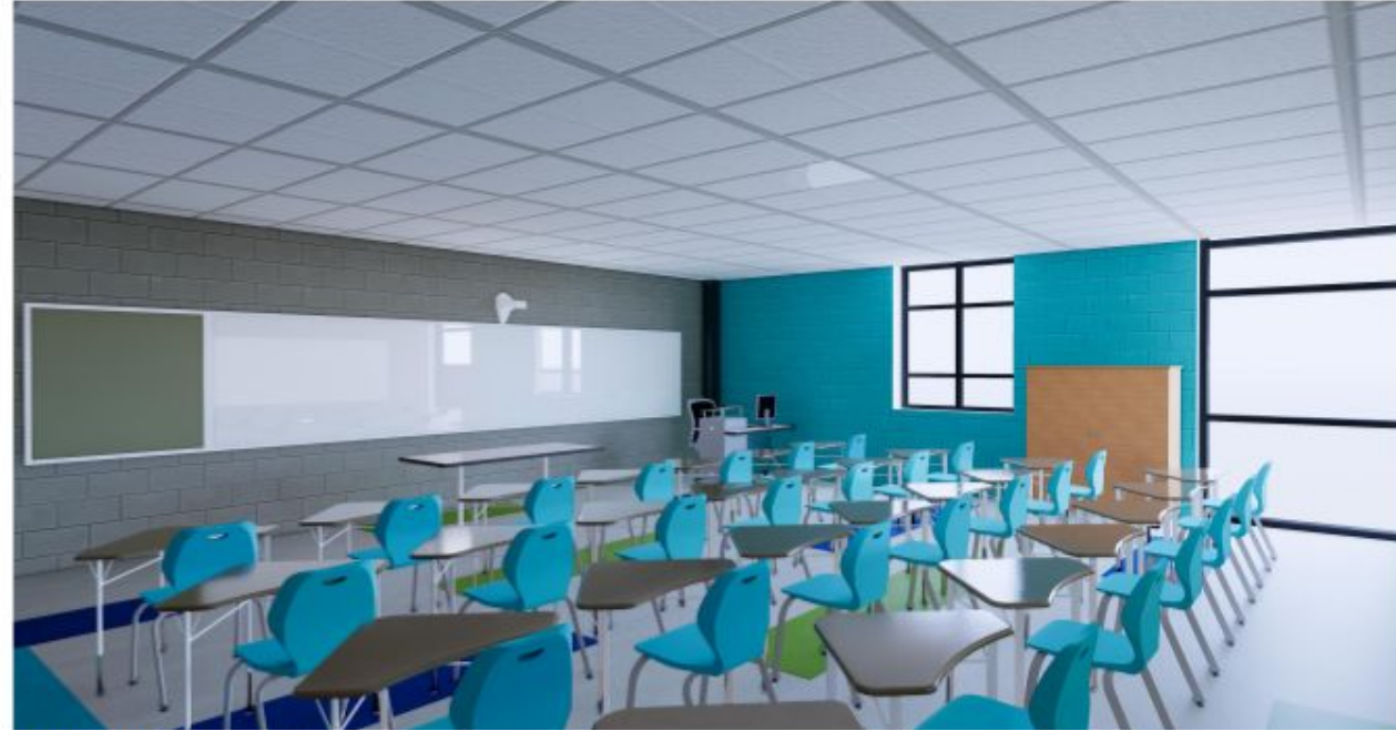
غرفة الفصل الدراسي