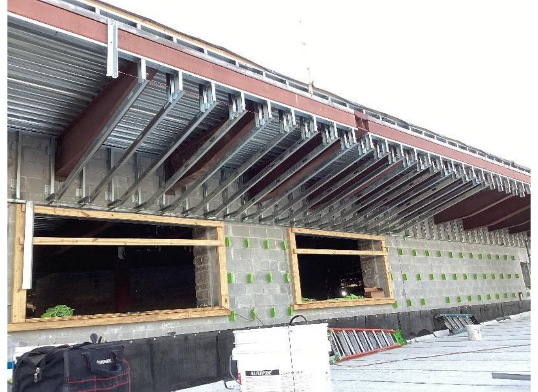
إطار سوفيت معدني