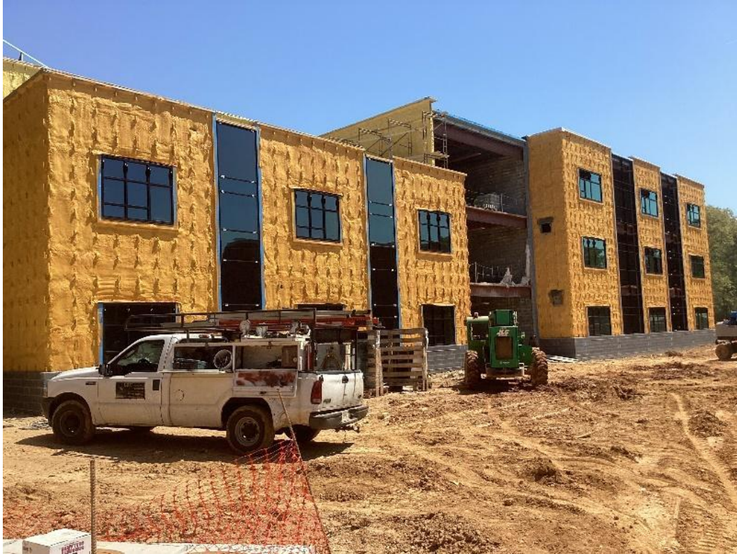
المنطقة ب وج - الرش بالرغوة، الجدران والستائر، والنوافذ