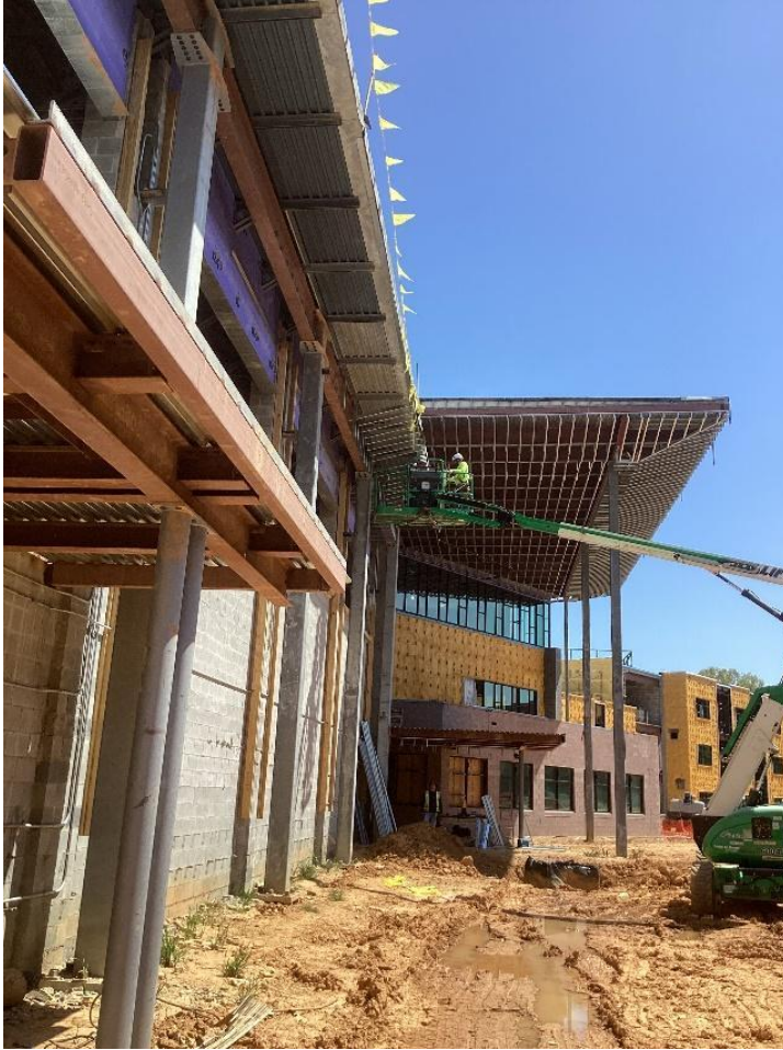
واجهة المنطقة ب