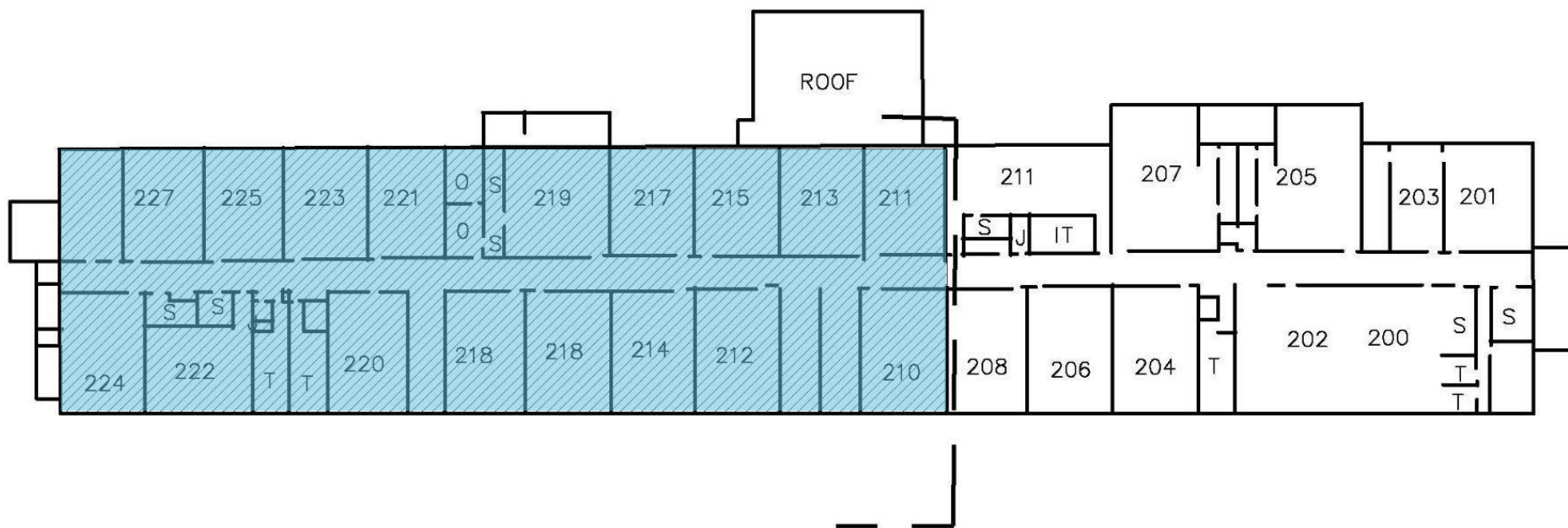
SECOND FLOOR PLAN